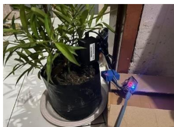
Gambar 6. Wujud Uji Coba Alat

Hasil pengujian menunjukkan bahwa sistem mampu bekerja dengan baik dalam membaca dan mengirimkan data pH tanah secara real-time . Sensor pH yang digunakan dapat mendeteksi perubahan kondisi tanah dengan stabil, sedangkan NodeMCU ESP32 berhasil mengirimkan data ke aplikasi Blynk tanpa kendala koneksi.