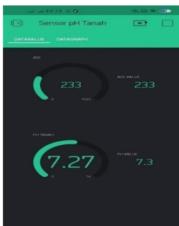
Gambar 7. Hasil Uji Coba User Blynk

Berdasarkan hasil pengujian yang ditampilkan pada aplikasi Sensor pH Tanah, sistem berhasil menampilkan nilai ADC (Analog to Digital Converter) dan nilai pH tanah secara real-time . Pada tampilan Data Value , nilai ADC yang terbaca sebesar 233, dengan hasil konversi pH sebesar 7,27. Nilai tersebut menunjukkan bahwa kondisi tanah berada pada kategori netral hingga sedikit basa, yang sesuai dengan kondisi ideal bagi pertumbuhan tanaman hias pucuk merah.