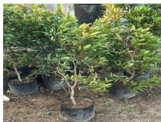
Gambar 5. Pucuk Merah

Pucuk merah merupakan tanaman hias yang umum dijumpai dan dapat tumbuh hingga mencapai tinggi sekitar 16–30 meter. Pada ukuran kecil sekitar 1–5 meter, tanaman ini dapat ditanam di dalam pot sebagai tanaman hias. Tanaman ini banyak tersebar di Timur Laut India, Myanmar, Thailand, Semenanjung Malaysia, Singapura, Sumatera, Kalimantan dan Filipina [12].