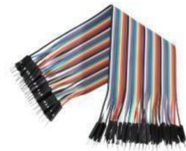
Gambar 3. Kabel Jumper

Kabel Jumper merupakan kabel elektrik yang berfungsi untuk menghubungkan antar komponen yang ada di breadboard atau papan arduino tanpa harus menggunakan solder, umumnya memang kabel Jumper sudah dilengkapi dengan pin yang terdapat pada setiap ujungnya [8]. Kabel jumper memiliki tiga jenis yang dapat dilihat dari ujungnya, yaitu: Male – Male , Male – Female , Female – Female [9].