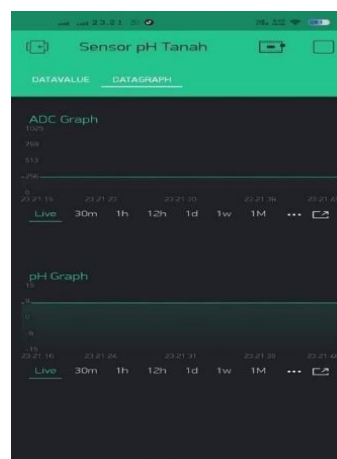
Gambar 8. Hasil Uji Coba User Blynk