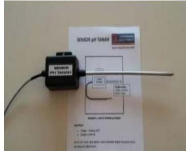
Gambar 2. Sensor pH Tanah

Sensor pH tanah digunakan untuk mengukur tingkat keasaman atau kebasaan tanah secara real-time . Sensor ini bekerja dengan mengubah nilai kimia tanah menjadi sinyal listrik yang dapat dibaca oleh mikrokontroler seperti NodeMCU atau Arduino.