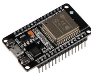
Gambar 1. NodeMCU ESP32